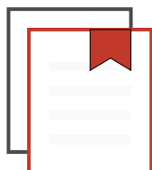
I ROMANZI DELLA RESISTENZA

Un film di Giuliano Montaldo (1976-2026: Cinquant'anni di Memoria)